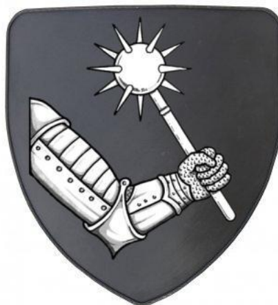
Štít s erbem rodu Tvrdišovců (replika)