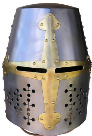
Hrncová přilba (replika)